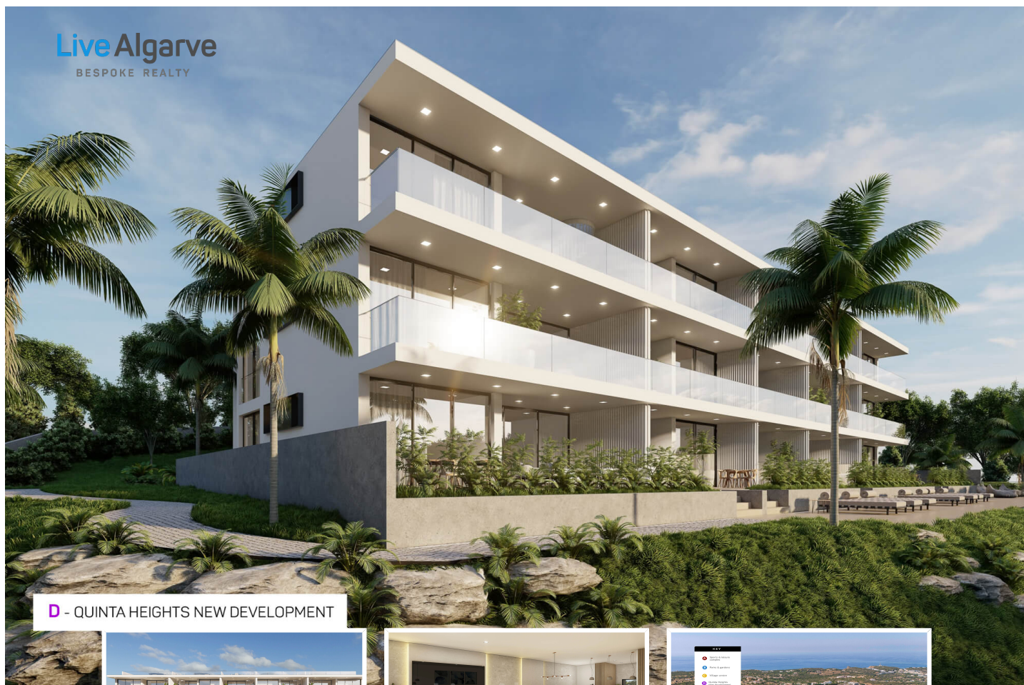
D - QUINTA HEIGHTS NEW DEVELOPMENT