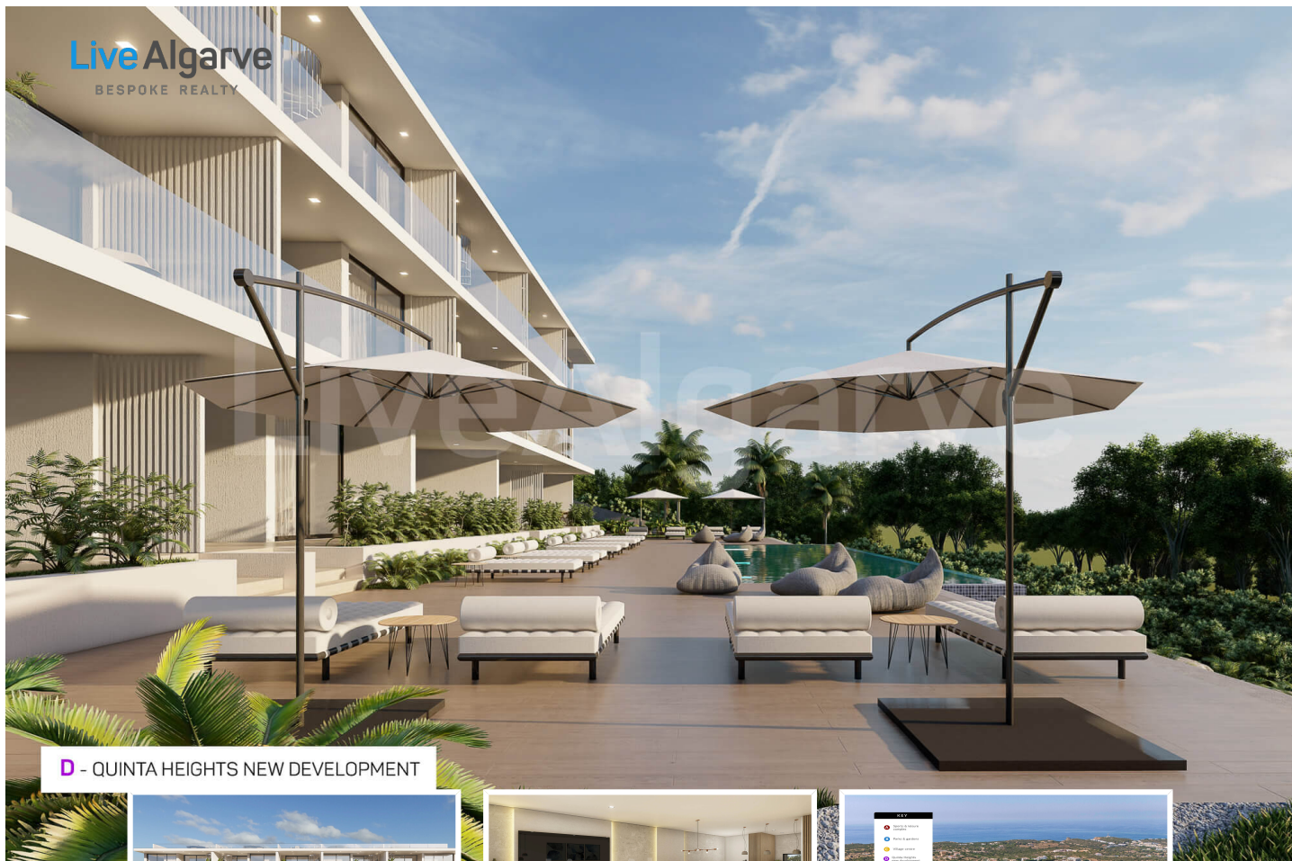
D - QUINTA HEIGHTS NEW DEVELOPMENT